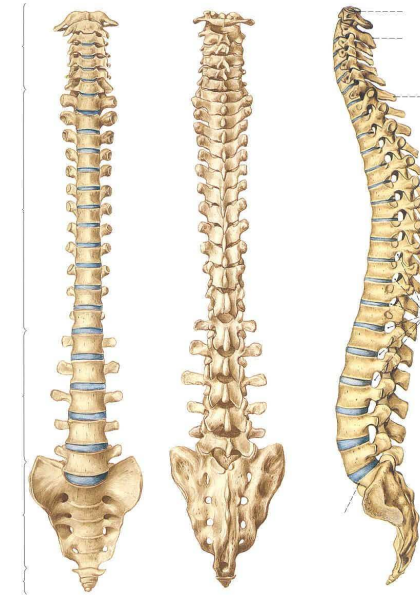
Tabla de Columna